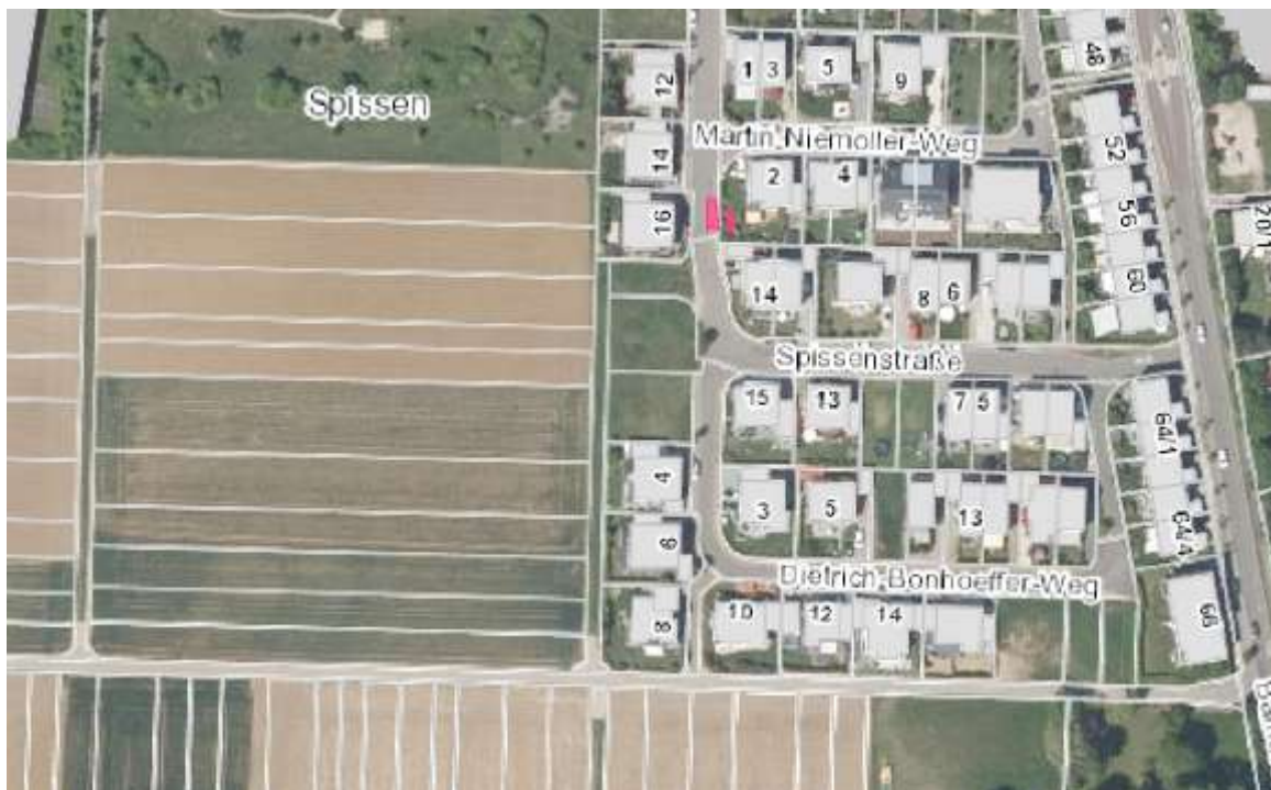
Abbildung 3 – Orthofoto (LUBW Kartendienst online)

Nach Norden schließen sich Grünflächen des Schul- und Sportgeländes an, ebenso nach Westen.