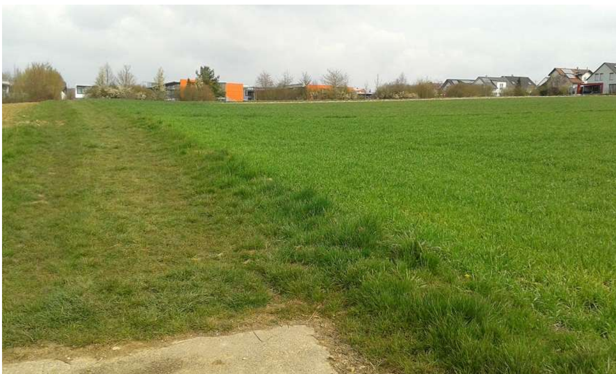
Abbildung 7 – Blick nach Norden auf die Schul- und Sportanlagen, rechts das Plangebiet, hier mit Einsatz von Wintergetreide auf Teilflächen