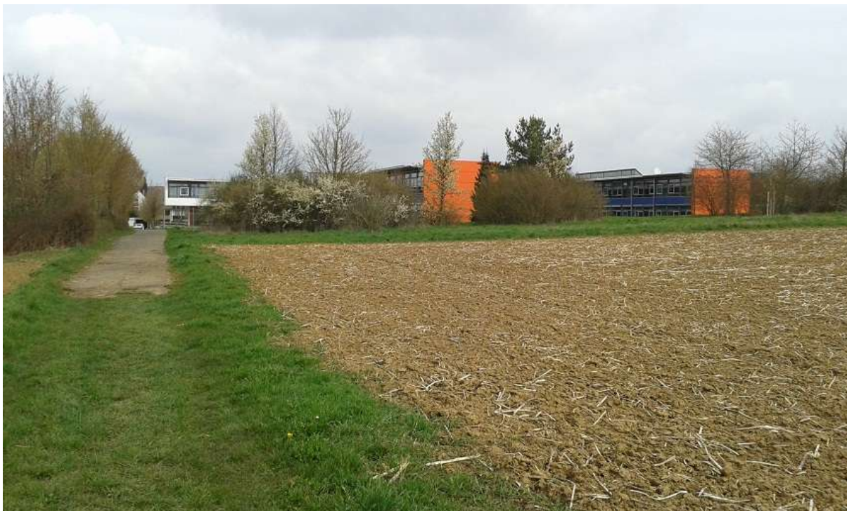
Abbildung 10 – Blick auf die angrenzenden Gehölzstrukturen (links westliche Kontaktlebensräume, Hintergrund: Grünanlagen im Norden des Vorhabengebietes)