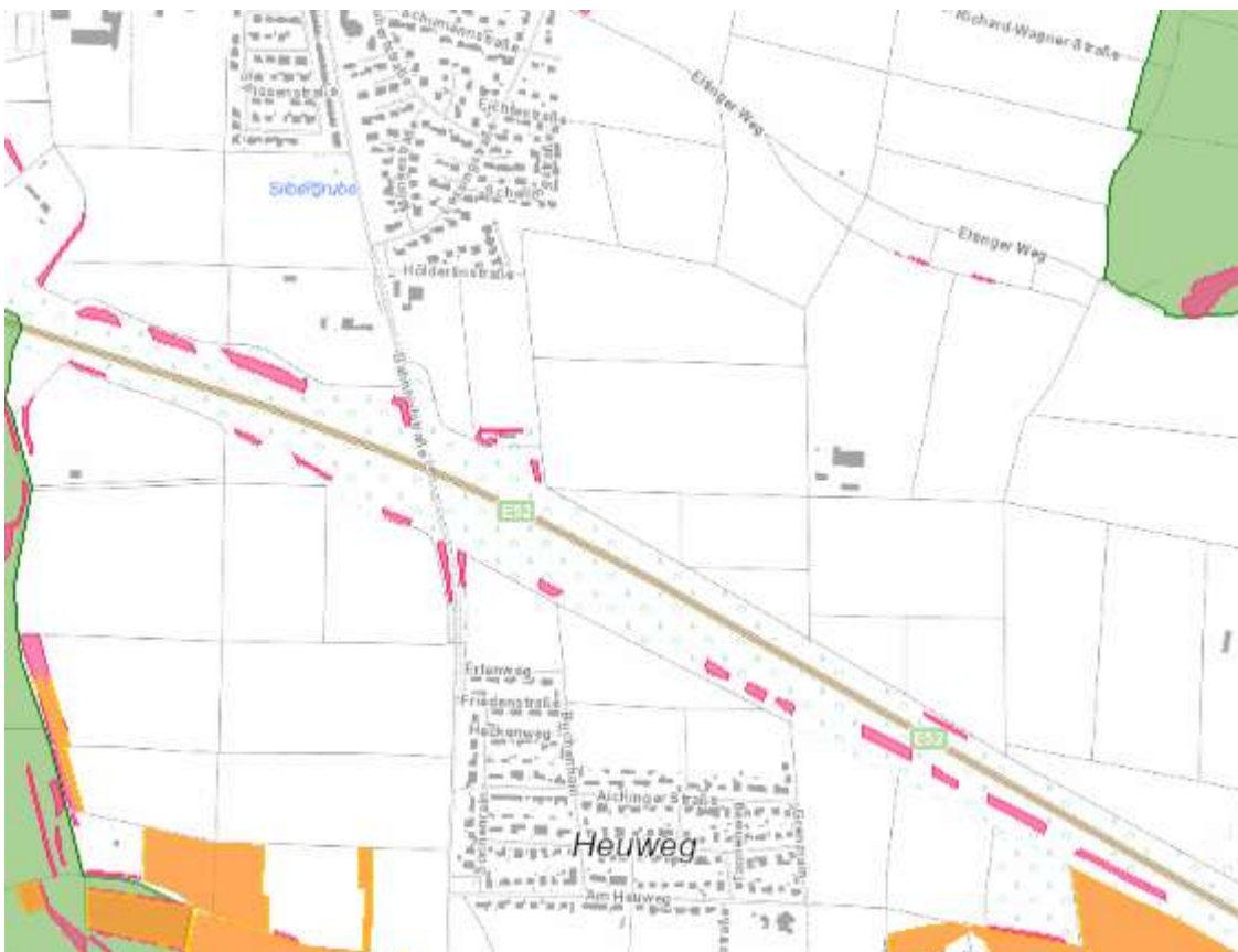
Abbildung 4 – Schutzausweisungen, rosa: Kartierte Biotop, grün: Landschaftsschutzgebiet, gelb: FFH-Grünland (LUBW Kartendienst online)

„Alle Teilflächen direkt auf der Böschung der Autobahn bestehen in der lichten bis dichten Strauchschicht v.a. aus Hasel, Hartriegel und Liguster. Weitere Gehölze wie Feld-Ahorn, Weißdorn und Schlehe sind in unterschiedlicher Häufigkeit beigemischt. Gelegentlich sind auch Bäume (Walnuss, Eschen, Äpfel, Zwetschgen und Ebereschen) dabei. Die Krautschicht ist, wenn vorhanden, ähnlich wie der Saum aufgebaut. Dieser ist zumeist gräserreich, ruderal, teilweise reich an Brennnessel- und Brombeere.“