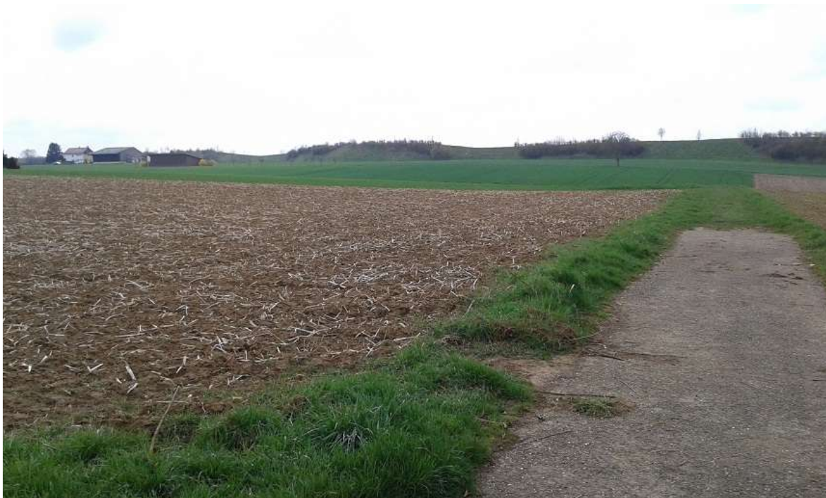
Abbildung 12 – Blick vom westlichen Rand des Vorhabengebietes nach Süden, in den angrenzenden Ackerflächen waren zwei Feldlerchen im Singflug zu beobachten