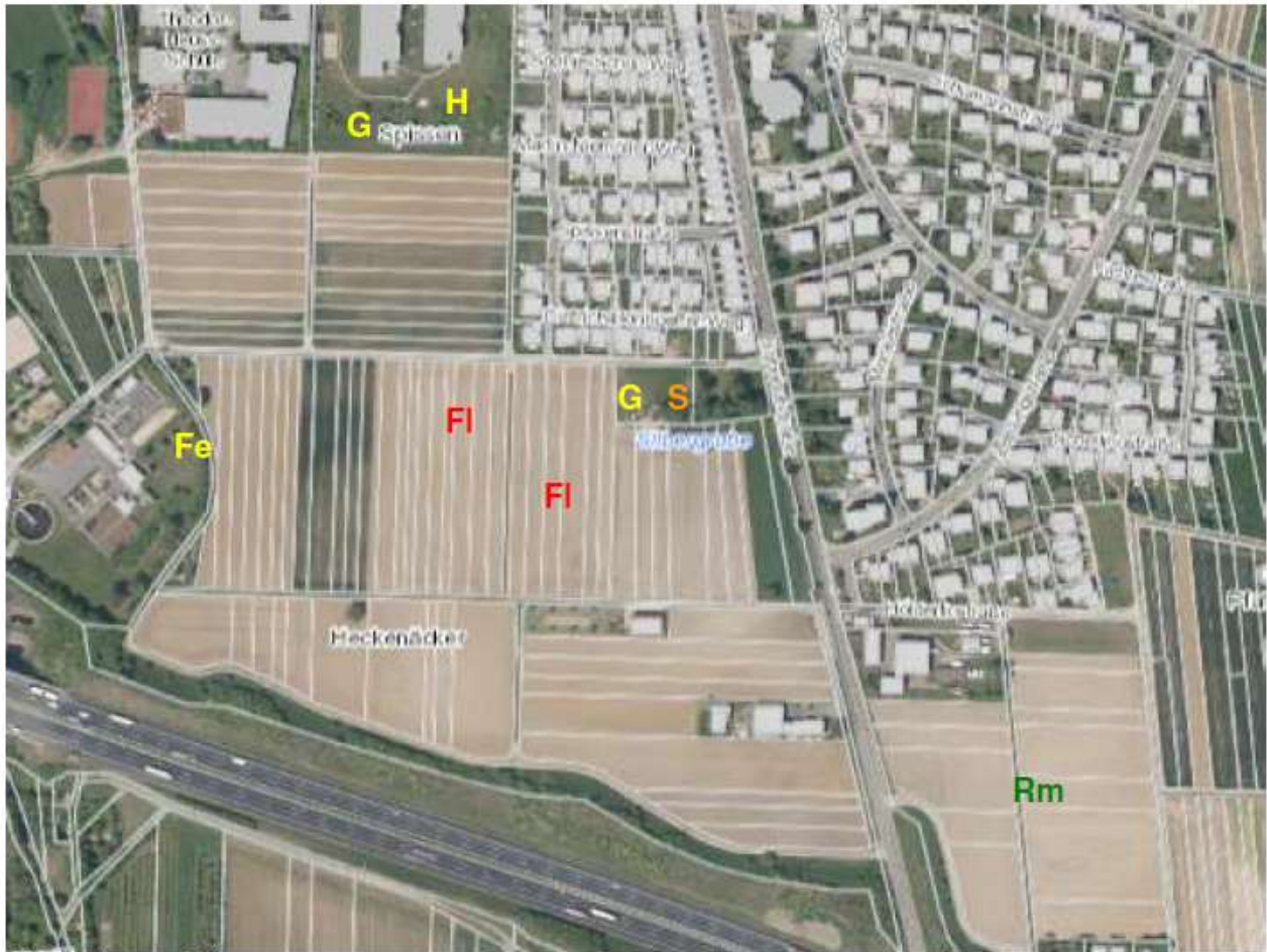
Maßstab: ungefähr 1: 5000

Fundorte/ Revierzentren bzw. Singwarten (siehe Tabelle Statusangaben) Kürzel siehe linke Spalte Vogeltabelle