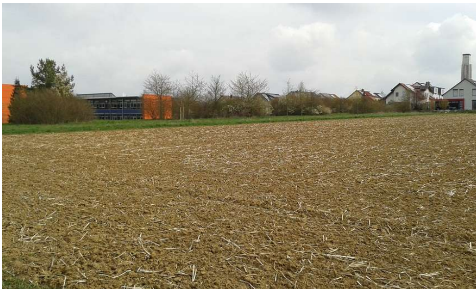
Abbildung 8 – Bei den ersten Begehungen waren die Flächen im Geltungsbereich überwiegend noch unbestellt