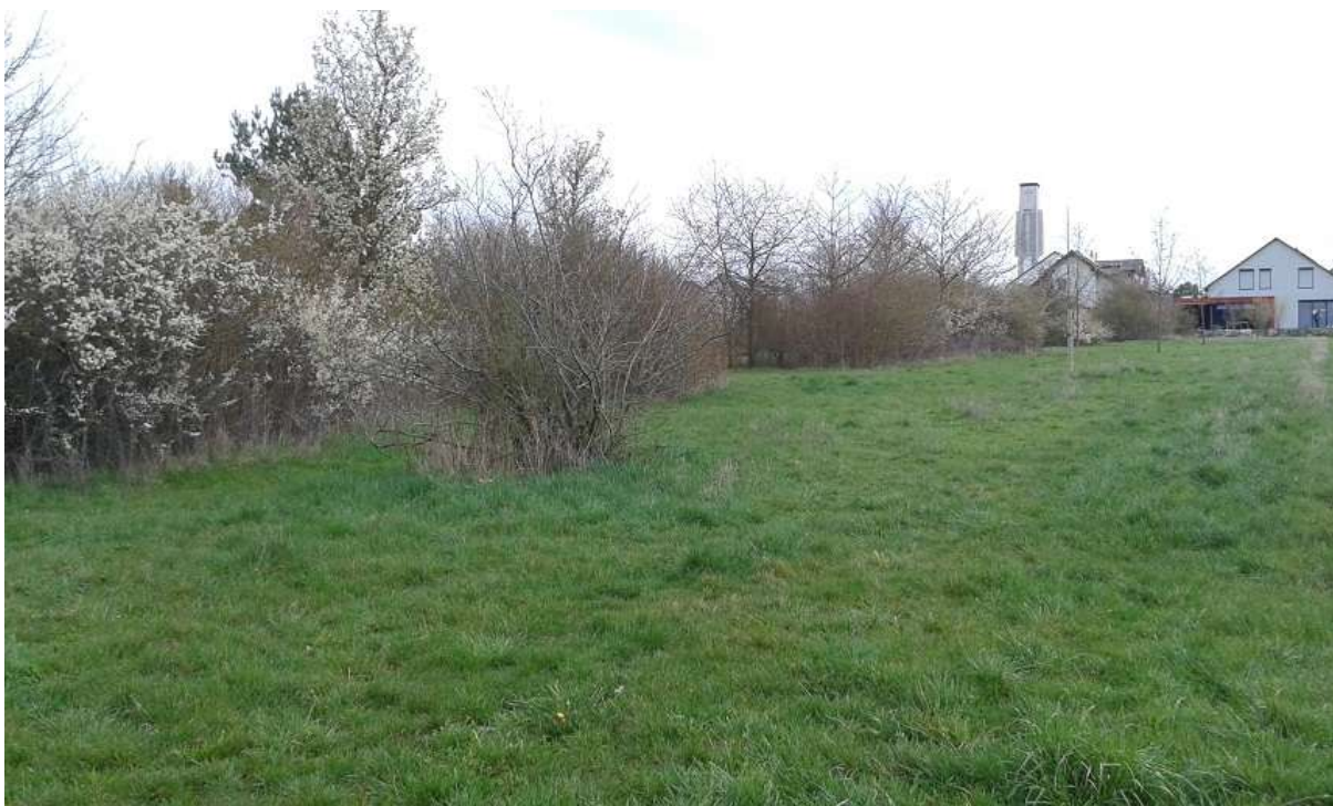
Abbildung 11 – Hecken und Grünflächen im Norden des Gebietes, man erkennt die blühende Schlehe