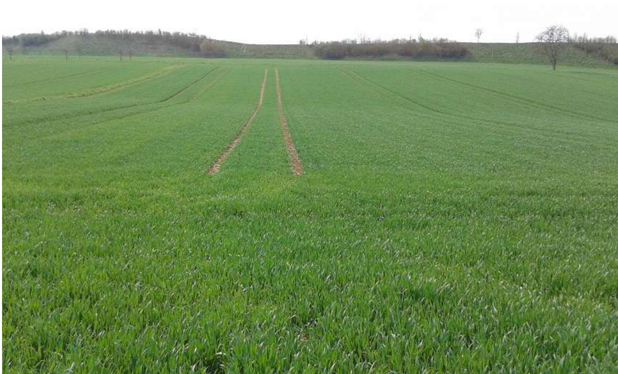
Abbildung 13 – ebene strukturarme Agrarflur mit Graswegen und Randstreifen im Süden des Plangebietes, für Spezialisten wie die Feldlerche ein potenzielles und im vorliegenden Fall aktuell genutztes Bruthabitat, hier mit Wintergetreide