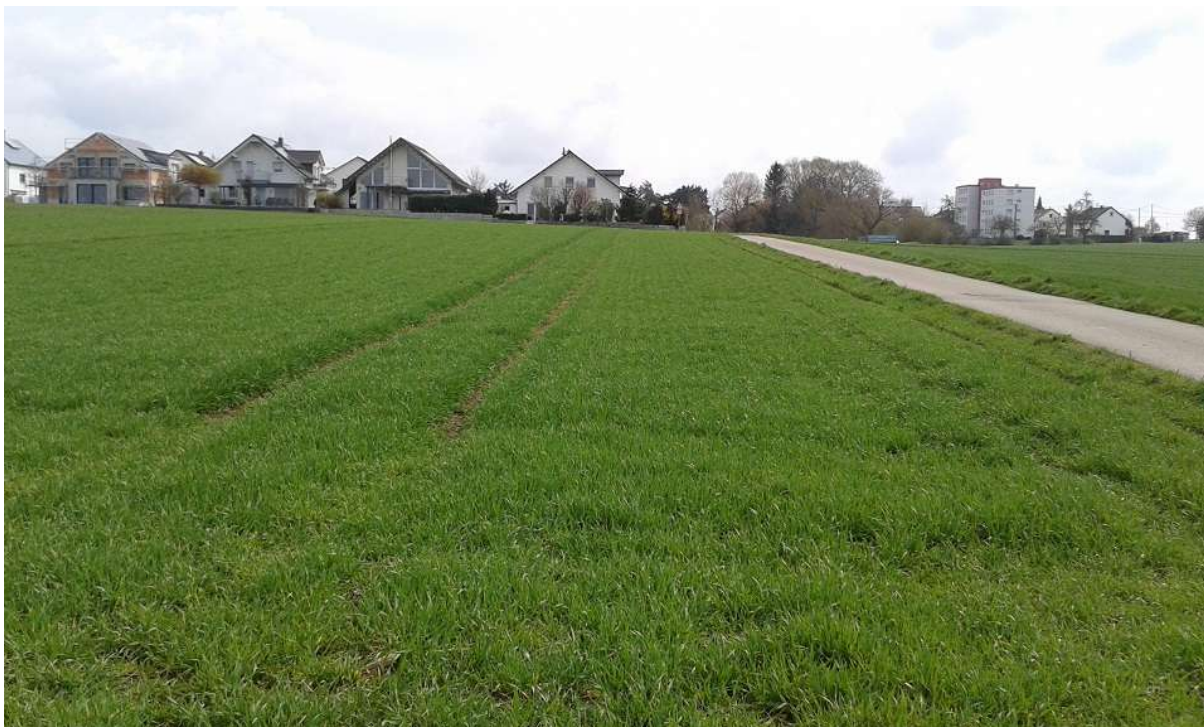
Abbildung 6 – Blick vom südwestlichen Rand des Geltungsbereiches nach Osten auf den bestehenden Siedlungsrand