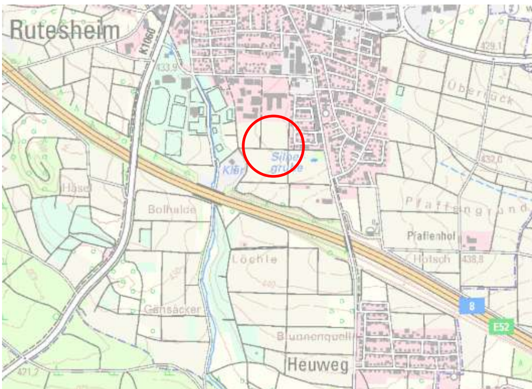
Abbildung 1 – Grobe Lage des Untersuchungsgebiets (Topogr. Karte aus LUBW Kartendienst online)

Um im Vorfeld zu prüfen, wo möglicherweise Konflikte für den Artenschutz entstehen, hat der Vorhabenträger diese Voruntersuchung/ Relevanzabschätzung in Auftrag gegeben. Anhand der Ergebnisse erfolgt ein Vorschlag zur weiteren Vorgehensweise.