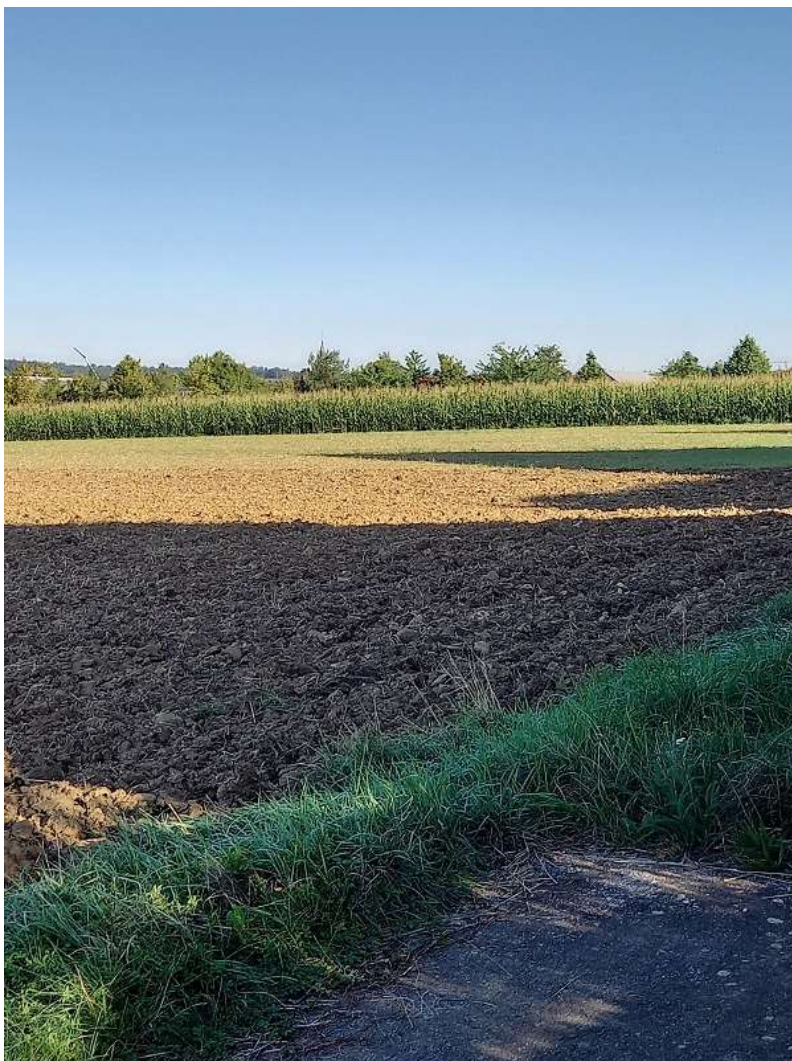
Abbildung 9 – Im Spätsommer war erkennbar, dass einige der Flächen im Vorhabensgebiet mit Mais bestellt waren