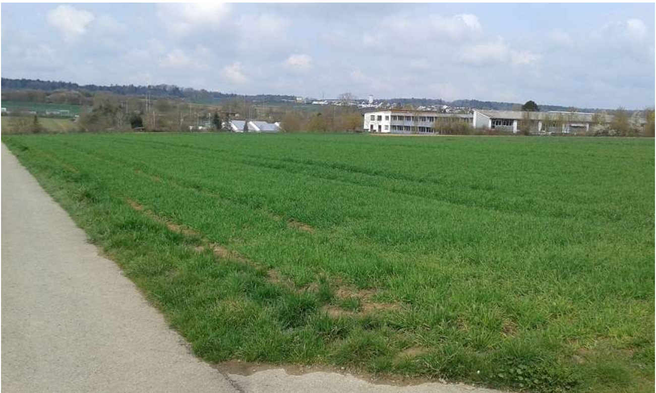
Abbildung 5 – Blick vom südöstlichen Rand auf das Vorhabensgebiet, im Hintergrund die Schul- und Sportanlagen

Der bestehende Siedlungsbereich an der Spissenstraße ist momentan noch als strukturarm zu bezeichnen, da die Gehölze noch jung und wenig entwickelt sind. Siehe auch nachfolgende Abbildungen. An den Schul- und Sportanlagen sind dichtere und ältere Gehölze vorhanden, die von der Zusammensetzung her als einheimische und standortgerecht bezeichnet werden können (Schlehe, Roter Hartriegel, Hainbuche, Ahorn- Arten...).